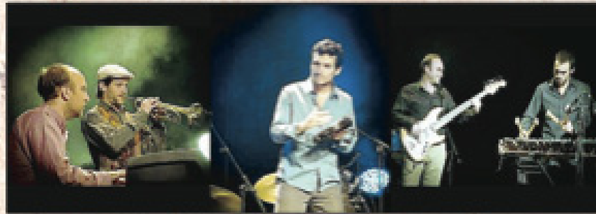
Traits d'Unions, vainqueur du tremplin jazz

U n batteur/ percussionniste, un bassiste, un pianiste et un trompettiste. Traits d'Unions sera en formule quartet sur la scène de Verdun, en première partie de Macéo Parker. C'est le cadeau de leur victoire du tremplin jazz.